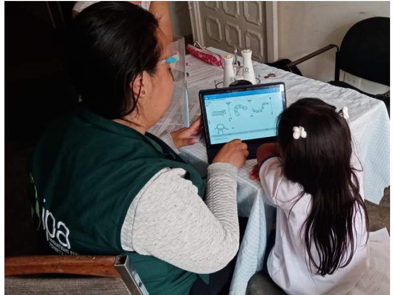
Una encuestadora aplica un test de habilidades cognitivas a una estudiante en Bogotá, Colombia.